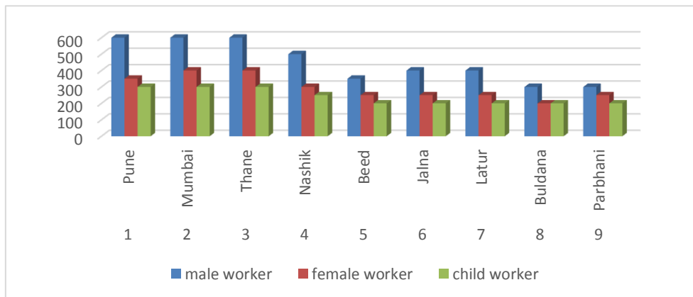
तक्ता . २

ref: (4th Employment-Unemployment Survey 2014 by Labour Bureau Chandigarh)